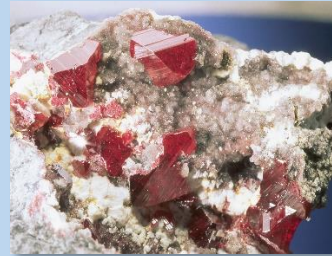
CRISTALIZACIÓN DE CINABRIO

El patrimonio geológico está unido al patrimonio minero, ya que las explotaciones mineras se llevan a cabo sobre los yacimientos minerales y las rocas, y éstos a su vez con el patrimonio histórico, arqueológico e industrial.