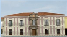
Casa Academia de Minas (S.XVIII)

Siempre que hablemos de Patrimonio, nos remontamos al pasado, a la historia... Esta herencia se compone de una gran variedad de cosas: inmateriales (formas de trabajar, nuestra lengua, recuerdos, fiestas, canciones, etc.) o materiales (edificios, libros, planos, objetos arqueológicos, etc.).