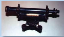
Instrumento topográfico (S.XIX)